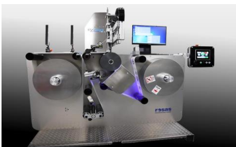
Integration für den Etikettendruck